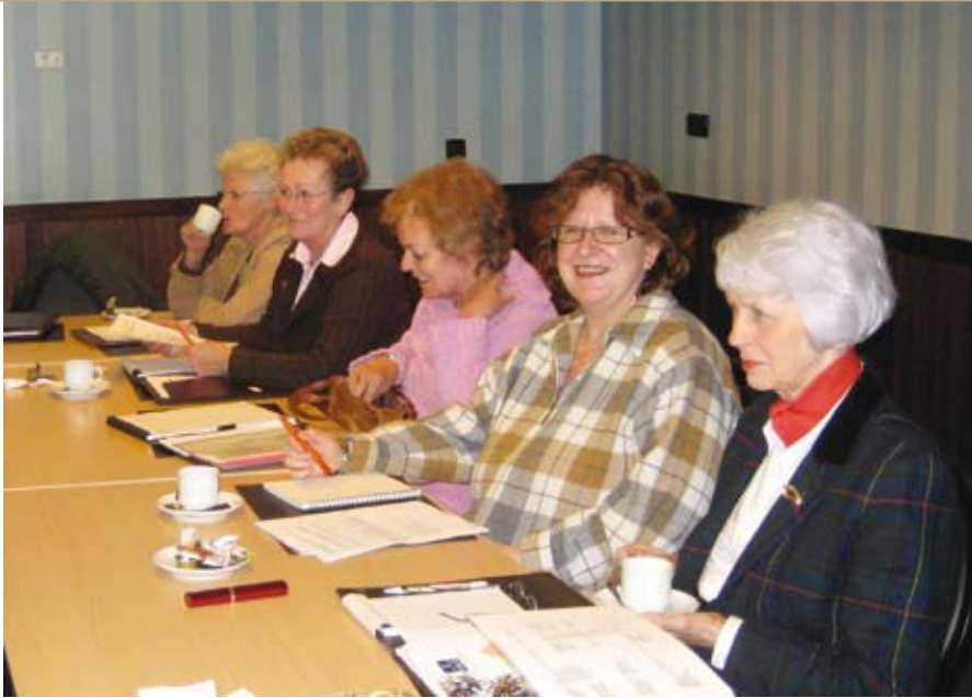
De eerste samenkomst van de pilotverenigingen met de Commissie Certificering kenmerkte zich door een uitstekende stemming. Dit zijn de dames van de Drentsche Patrijshonden, Norwich Terriers en Schnauzers.

De noodzaak van certificering werd door deze rasverenigingen nog eens van harte onderschreven. Argumenten zoals zorgvuldig fokken, het welzijn van de rashonden (populaties) en het zichtbaar maken voor de aspirant-puppykoper waar deze een op verantwoorde wijze gefokte pup kan kopen, werden genoemd. Dat zijn voor deze rasverenigingen geen loze kreten maar een vanzelfsprekendheid.