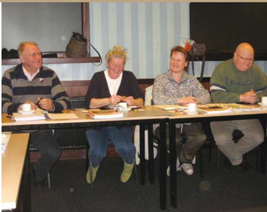
Twee leden van de Commissie Certificering met twee leden van een deelnemende rasvereniging (rechts), de Nova Scotia Duck Tolling Retriever Club Nederland.

te vragen. Dan kan er achteraf daarover geen discussie meer ontstaan.